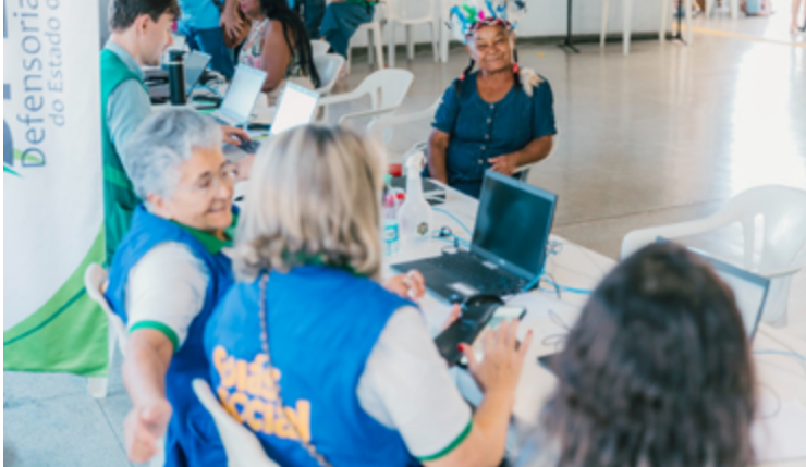
Evento busca ampliar a discussão sobre o princípio da autodeterminação dos povos

Evento discute a garantia de direitos dos povos indígenas, além de disponibilizar serviços gratuitos à comunidade