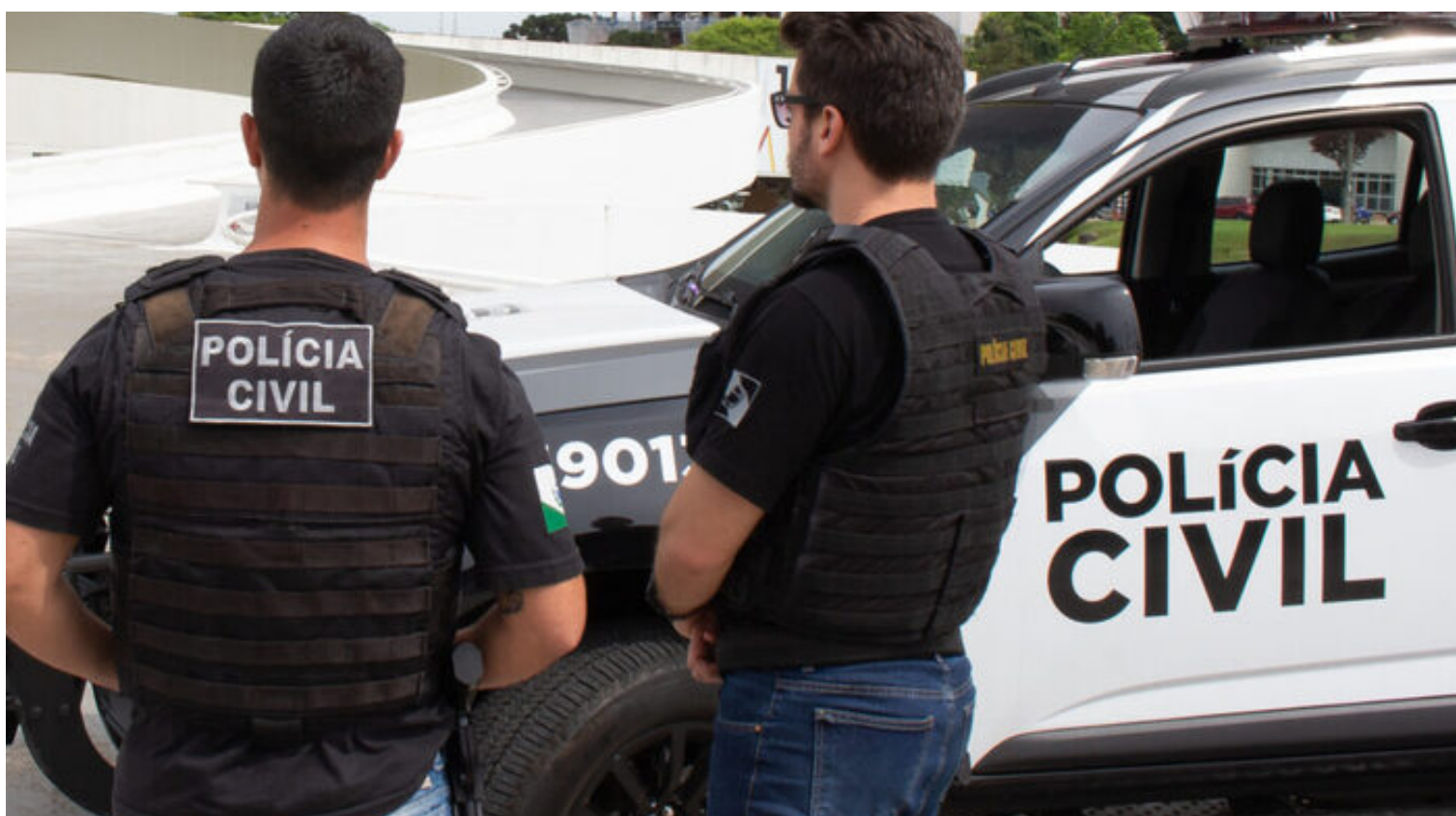
O adolescente foi localizado no bairro Jardim Barragem I, após intensos levantamentos realizados pelo Grupo de Investigação de Homicídios