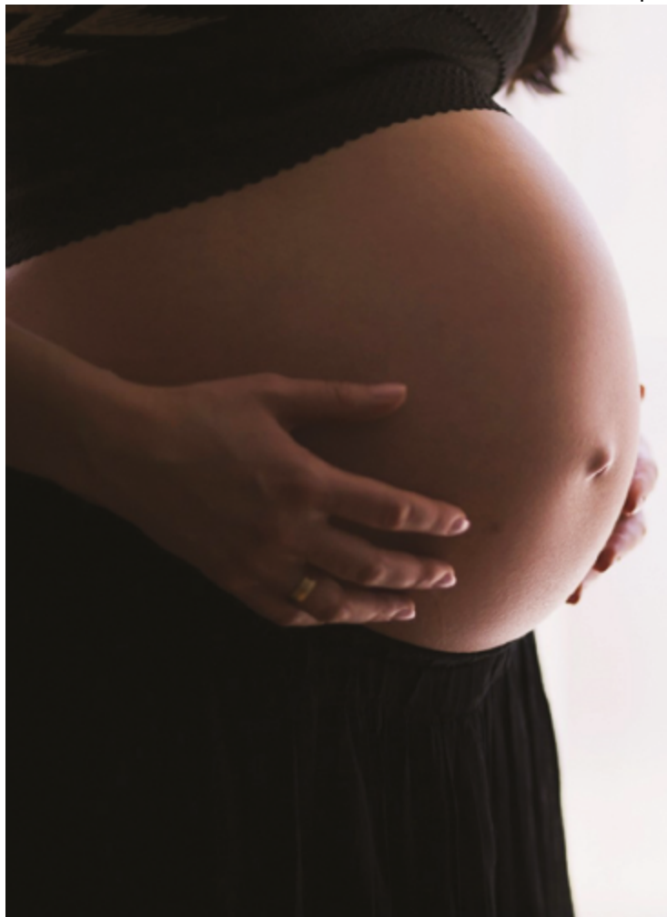
Condição afeta indivíduos no período intrauterino, quando pode ser detectada

Durante o ultrassom do primeiro trimestre, que ocorre entre