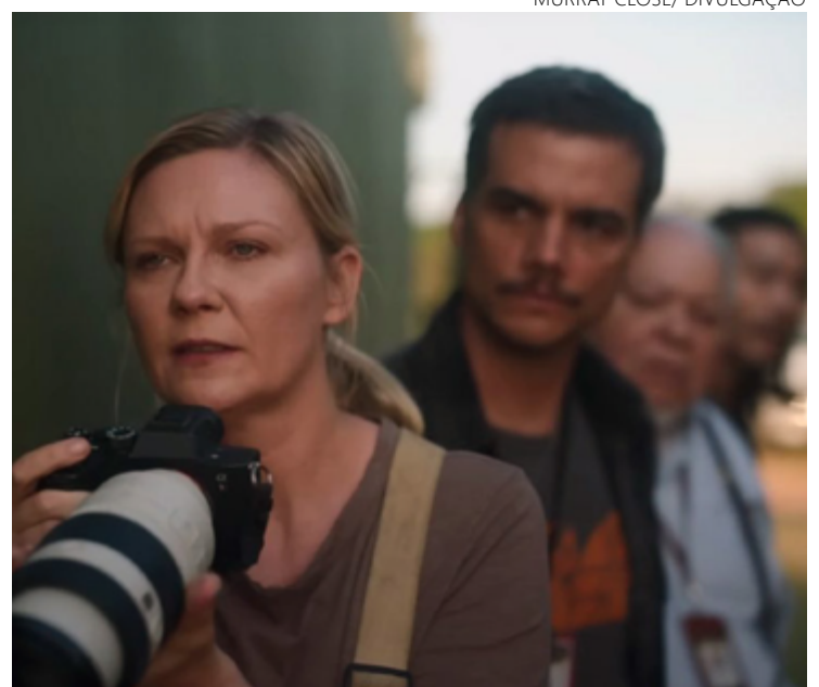
Kirsten Dunst em ação: fotojornalismo tem lugar de destaque na trama