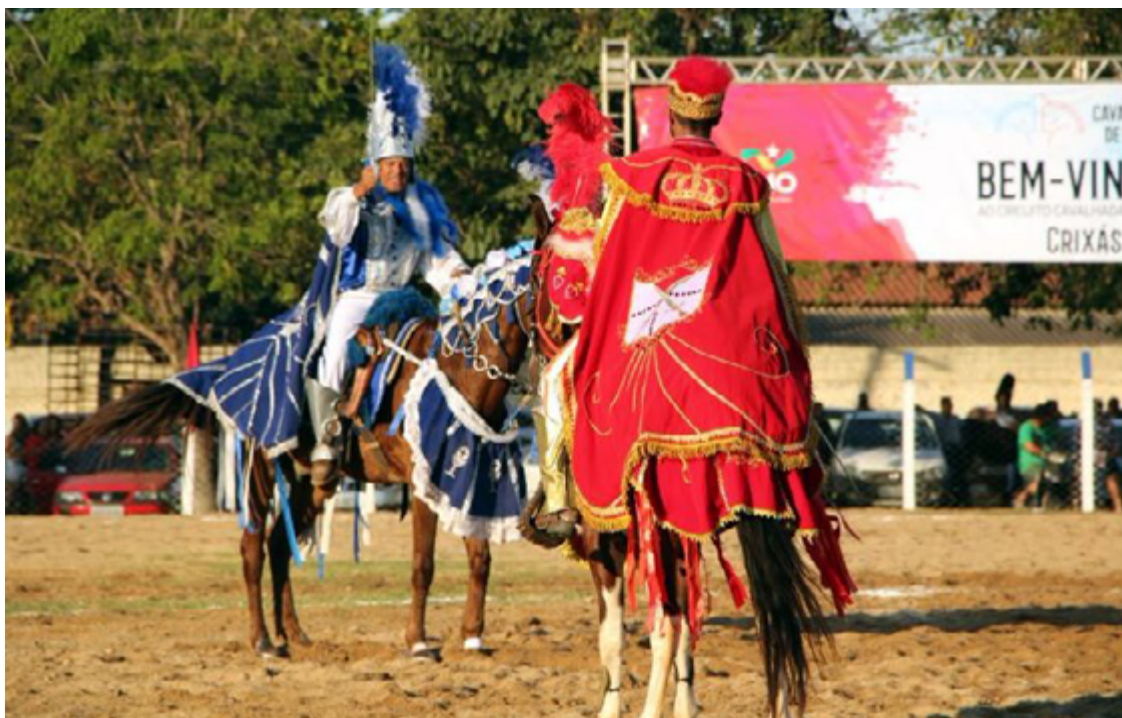
Cavalcadas de Pirenópolis serão de 19 a 21 de maio, no Módulo Esportivo, na GO-338

“Estamos preparados para deixar qualquer local escolhido pela cidade apto e seguro para realização dos folguedos”, ressalta Yara Nu-