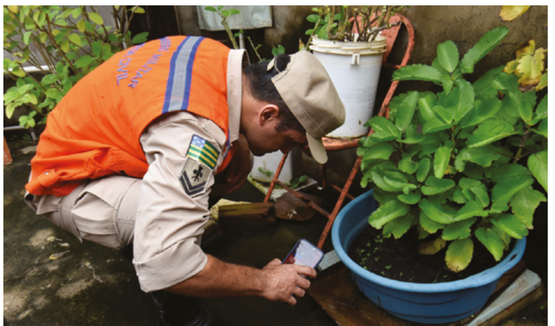
Iniciativa estabelece ações que visam incentivar os municípios a desenvolverem ações eficazes de combate às endemias

"O apoio da comunidade, cuidando do seu próprio quintal, é fundamental nesta questão, mas penso que avançamos quando buscamos a inovação.