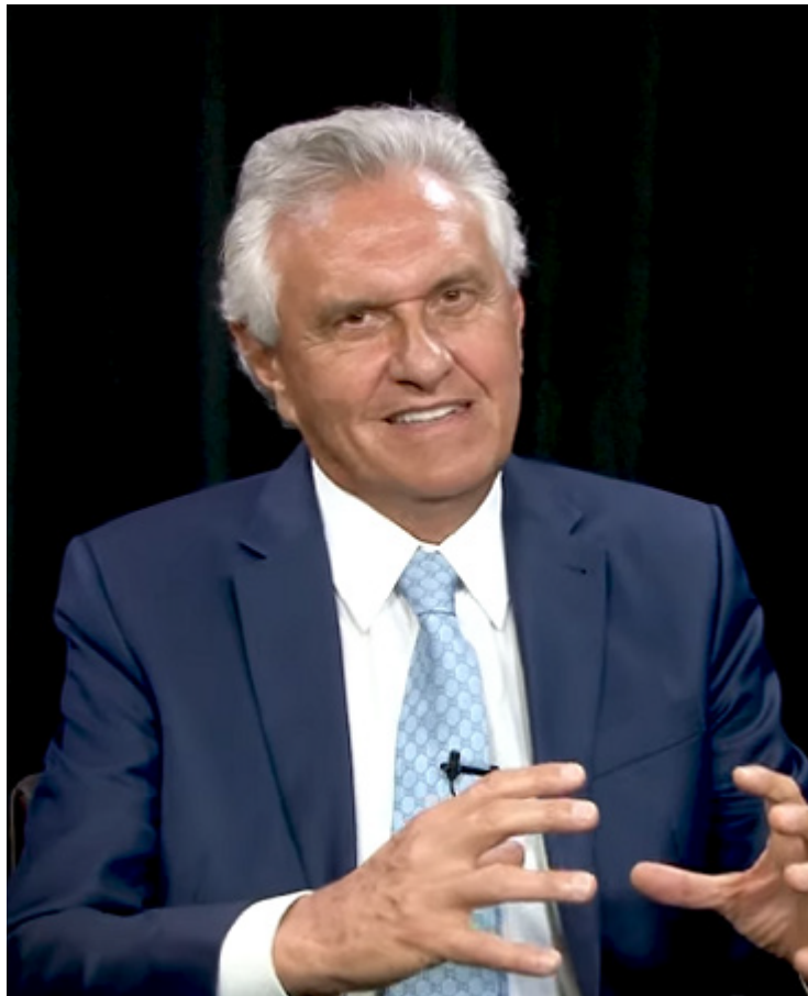
Ronaldo Caiado: críticas ao governo Lula e avanços no eleitorado de centro e de direita

“Como é que ela [a economia] vai caminhar? No momento em que você vê o presidente perdendo a vontade de governar. Você não vê o governo com ações concretas, ele está se esvaziando por falta de eficiência. Essa é uma realidade. Junto com isso, sem dúvida nenhuma, está a economia. Uma reforma tributária que ainda não foi sequer regulamentada. Não sabemos nem qual será a real carga tributária