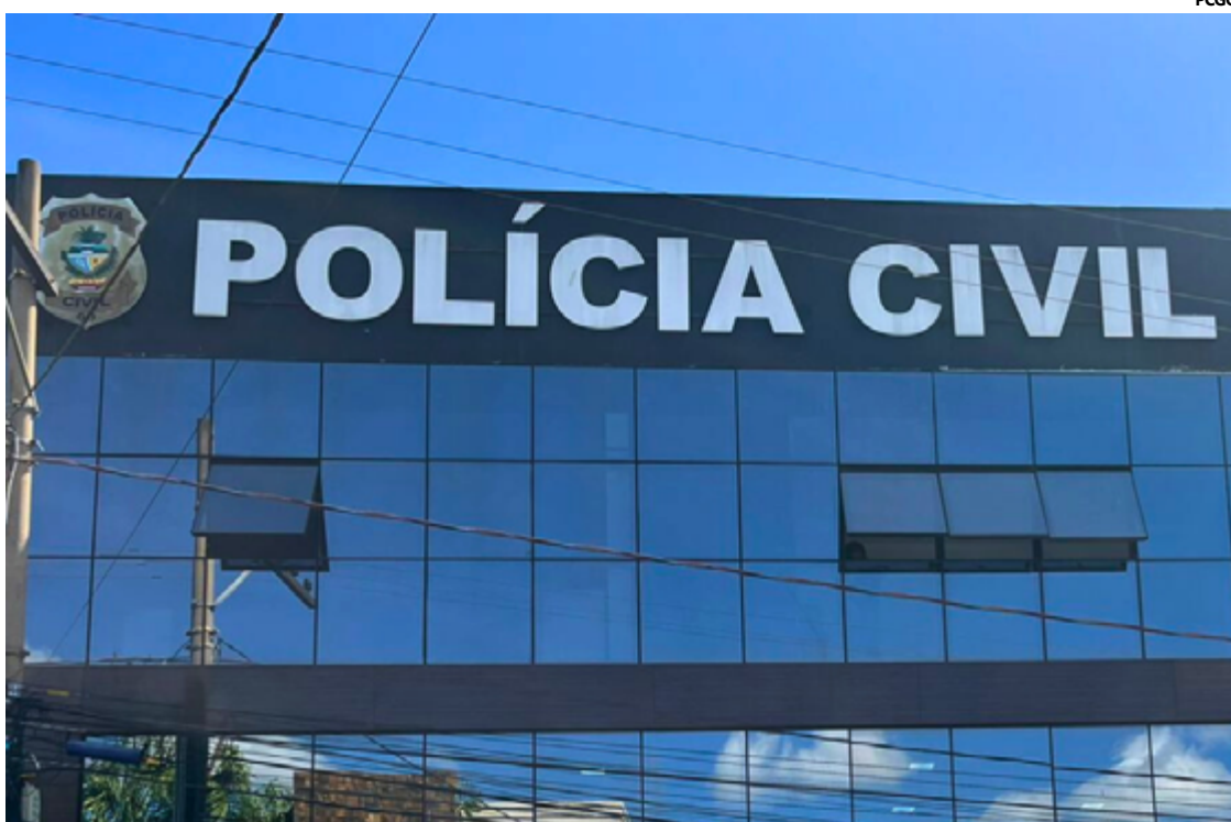
A Polícia Civil de Goiás, através do Grupo de Investigação de Homicídios de Luziânia – 5ª DRP, efetuou prisão de uma mulher

A identidade da autora não foi divulgada pela polícia. O caso segue sob investigação para esclarecimento de eventuais cúmplices ou outras circunstâncias relacionadas ao crime.