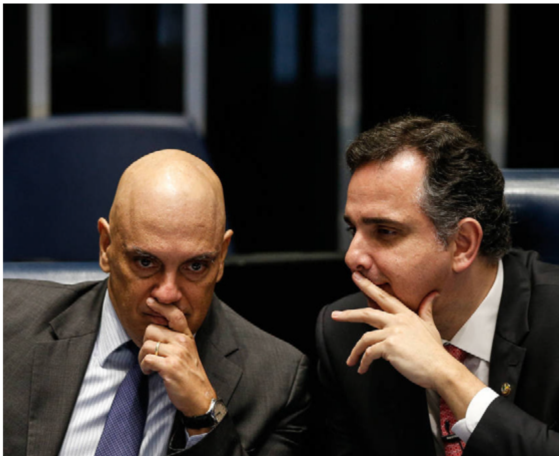
Alexandre de Moraes e Rodrigo Pacheco: ambiente de apreensão entre membros do Congresso e do STF

Moraes tirou fotos com o grupo de juristas presidido pelo ministro do STJ (Superior Tribunal de Justiça) Luis Felipe Salomão durante a entrega do texto a Pacheco no gabinete da