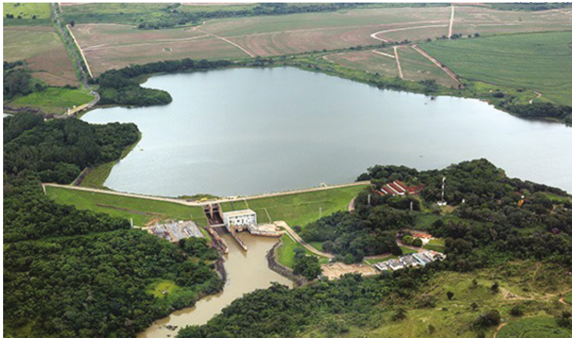
Processo é gratuito e obrigatório, e deve ser feito no Sistema Estadual de Segurança de Barragens até 30 de abril

Os principais usos informados para essas barragens são abastecimento de água, regu-