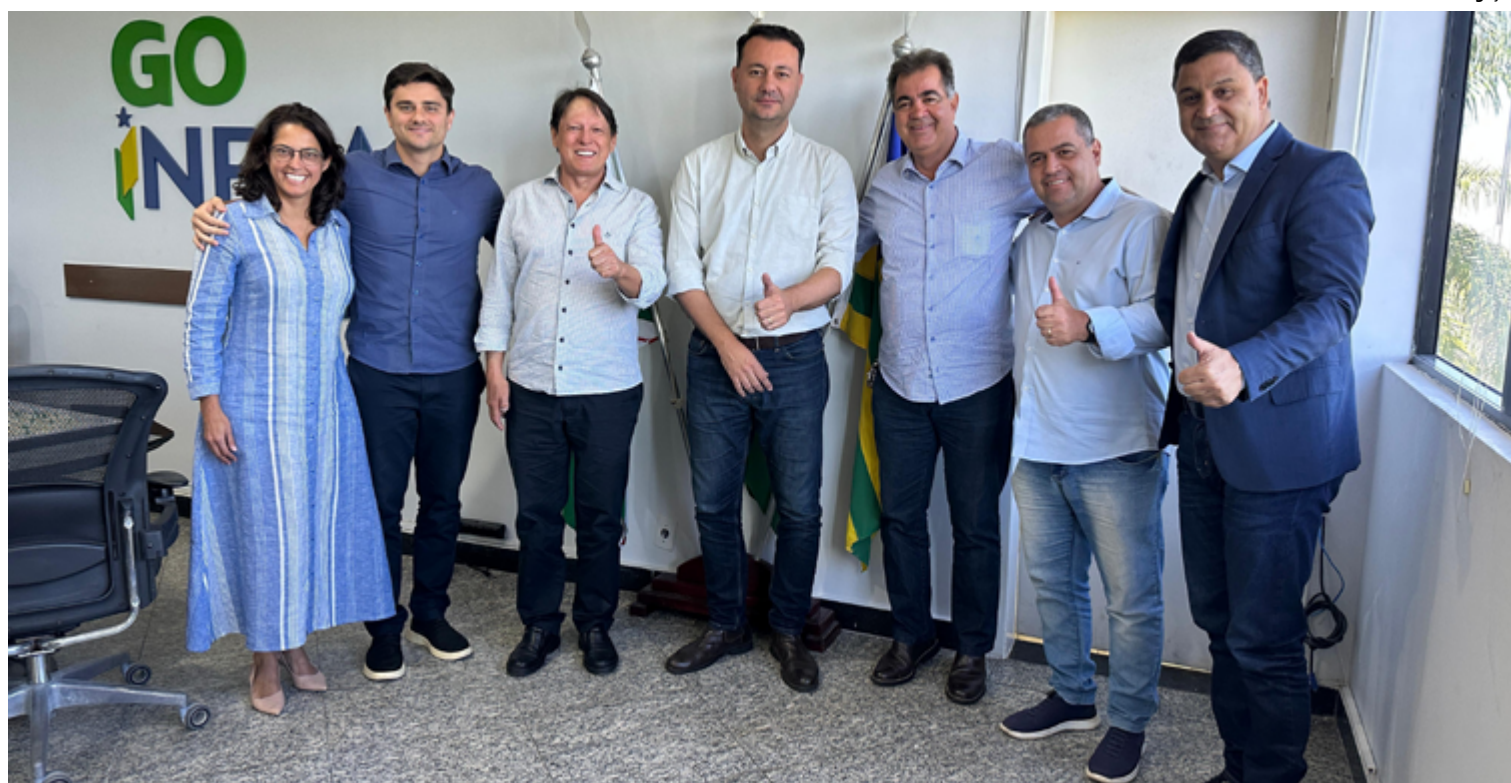
Entre os motivos citados para a realização da obra estão o desenvolvimento regional, a melhoria da segurança dos moradores e visitantes e a maior fluidez do tráfego regional

“Este é um acesso crucial entre a região do Entorno Sul do Distrito Federal e Brasília. A duplicação traz mais segurança, trafegabilidade, além