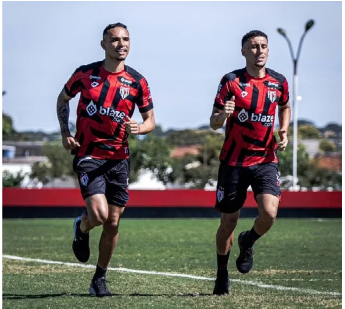
Equipe Goiana tenta esquecer a primeira rodada e busca sua primeira vitória na competição