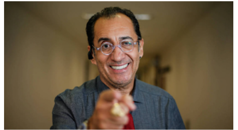
Jorge Kajuru segue orientação do PSB em Goiânia